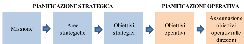
Tavola 4 Struttura del piano e "albero della performance"